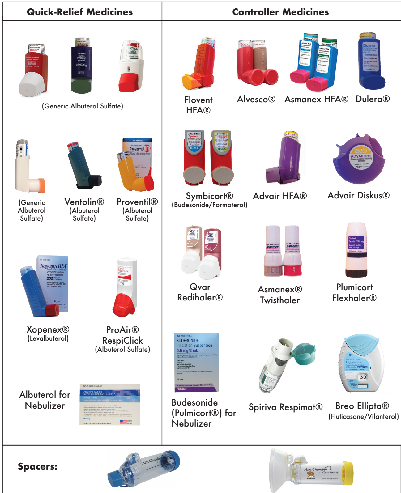
Gráfico de medicamentos para el asma

Solo con fines educativos. Para CONSEJOS médicos específicos, diagnóstico y tratamiento, consulte a su médico. Derechos de autor de la información de Children's of AL 11/23.